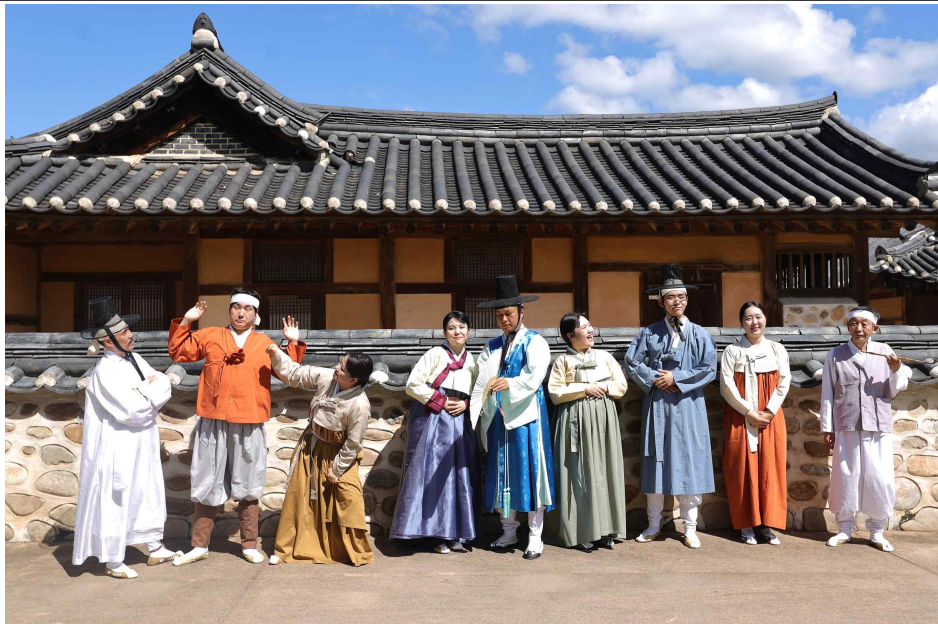
▲ 마당극 '정약용 선생님과 하루' 출연 배우 단체 사진